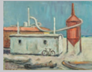
5. Silos Olio su tavola 40x50 1950