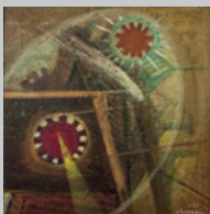
4. Simbolismo meccanico Composizione Olio su compensato 43 x 40 1970