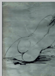
8. Nudo di schiena Disegno su lastra metallo 33x29 1960 ca.