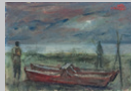
6. Marina con patino Olio su cartone 24x34 1952