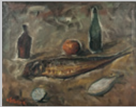
1. Natura morta con aringa Olio su tela 44x56 1940 ca.