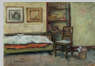
7. Interno dell'Atelier Olio su tela 34x43 1954