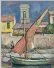
2. Trabaccolo all'Annunziata Olio su compensato 40x30 1954 ca.