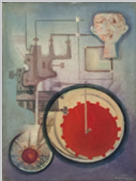
3. Simbolismo meccanico con figura Olio su tela 70x50 1972